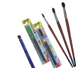
ジョイフル2で見つけた デッサン用鉛筆、筆ペン、絵筆 (右ページ参照)